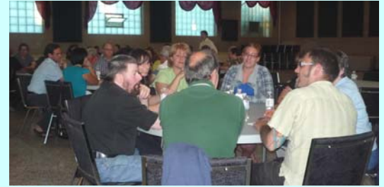
Lors de la soirée Diagnostic (groupe-cible)